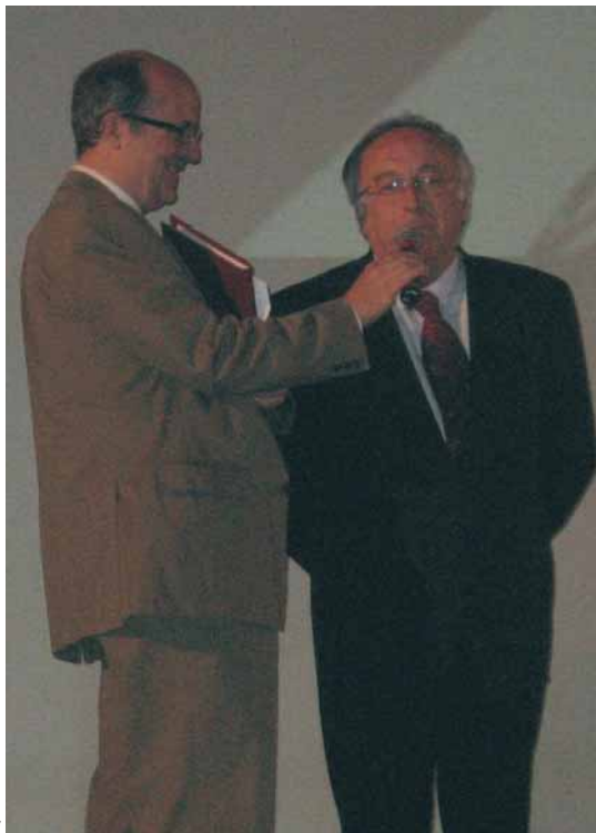
Le foto in queste pagine si riferiscono all'edizione precedente del premio Libero Grassi